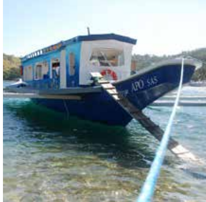
Stairways båd er en traditionel bangka med udrigger, bygget på et lokalt værft i glasfiber på et skelet af træ. Båden har plads til 50 personer.

Stairway arbejder også på andre måder med at styrke opmærksomheden om miljøbeskyttelse og bevarelse af natur. Det sker bl.a. ved at mobilisere unge til at rense strande og indsamle affald og til at bliver ambassadører for miljømæssig ansvarlighed. For et par måneder siden blev SAS-programmet formelt anerkendt af det filippinske undervisningsministerium som en del af de lokale gymnasiers pensum. Det betyder, at den sejlede miljøskole fremover bliver en fast del af alle børn og unges skolegang i Puerto Galera-området.