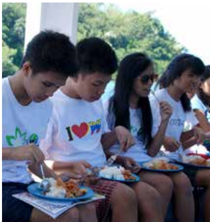
Der er lagt vægt på, at båden også fungerer som undervisningslokale.