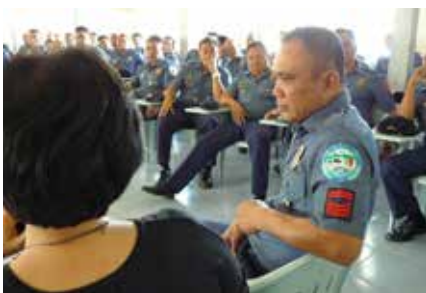
En gruppe politifolk under træning på Stairways center på Mindoro