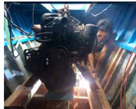
Stairways båd blev i vinteren 2015 opgraderet med bl.a. en ny og stærkere motor, forstærkninger i skroget og et mere avanceret navigationssystem.